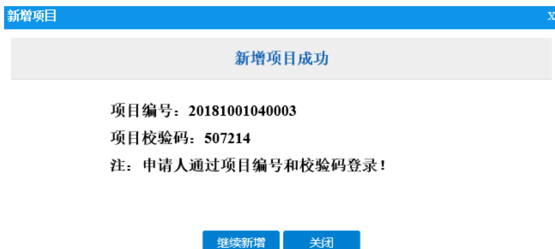
图 3-4 项目编号和项目校验码

4) 填写完成后点击“确定新增”，显示新增项目成功并生成项目编号和项目校验码（如图 3-4）。请牢记项目编号和校验码，申请人将凭此登录项目申报系统进行申报。