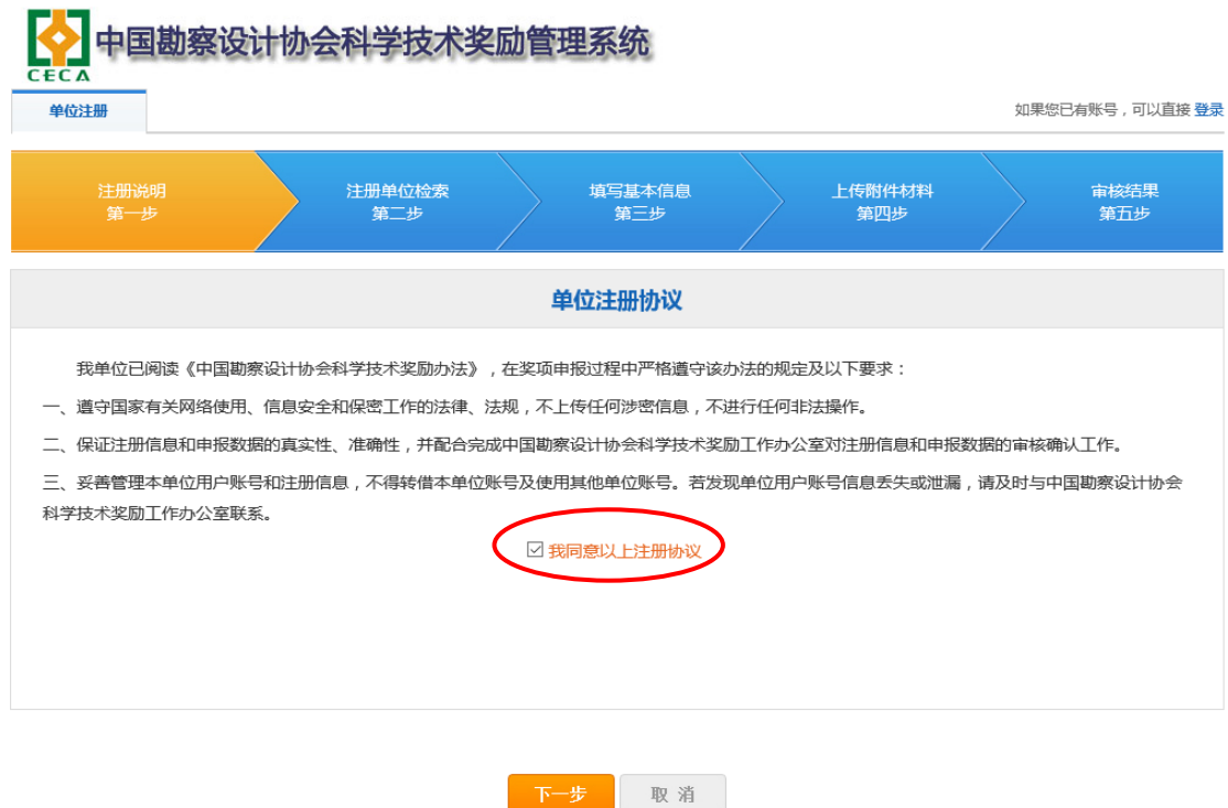
图 2-2 单位注册