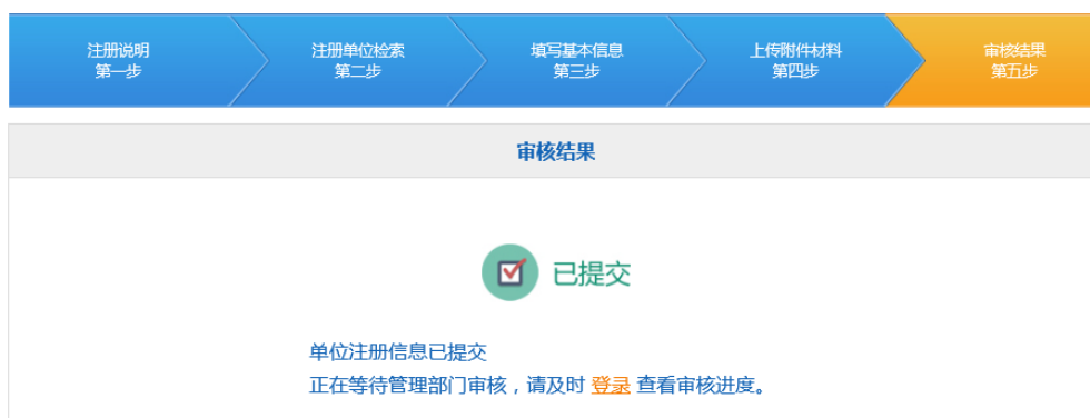
图 2-8 审核结果

7) 提交成功等待管理部门审核，可及时登录查看审核结果（如图 2-8）。审核通过后，可登录申报单位系统，开始申报。