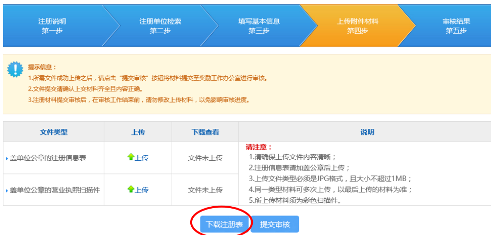
图 2-6 上传附件材料

6) 点击下一步进入“上传附件材料”页面（如图 2-6）。下载注册表，打印后盖单位公章，上传盖单位公章的注册信息表和营业执照扫描件（上传材料要求 JPG 格式，大小不超过 1MB）。上传完成可查看和下载，检查无误后点击“提交审核”（如图 2-7）。