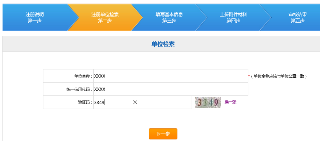
图 2-3 注册单位检索

3) 仔细阅读《单位注册协议》并勾选“我同意以上注册协议”，点击下一步进入“注册单位检索”页面（如图 2-3）。