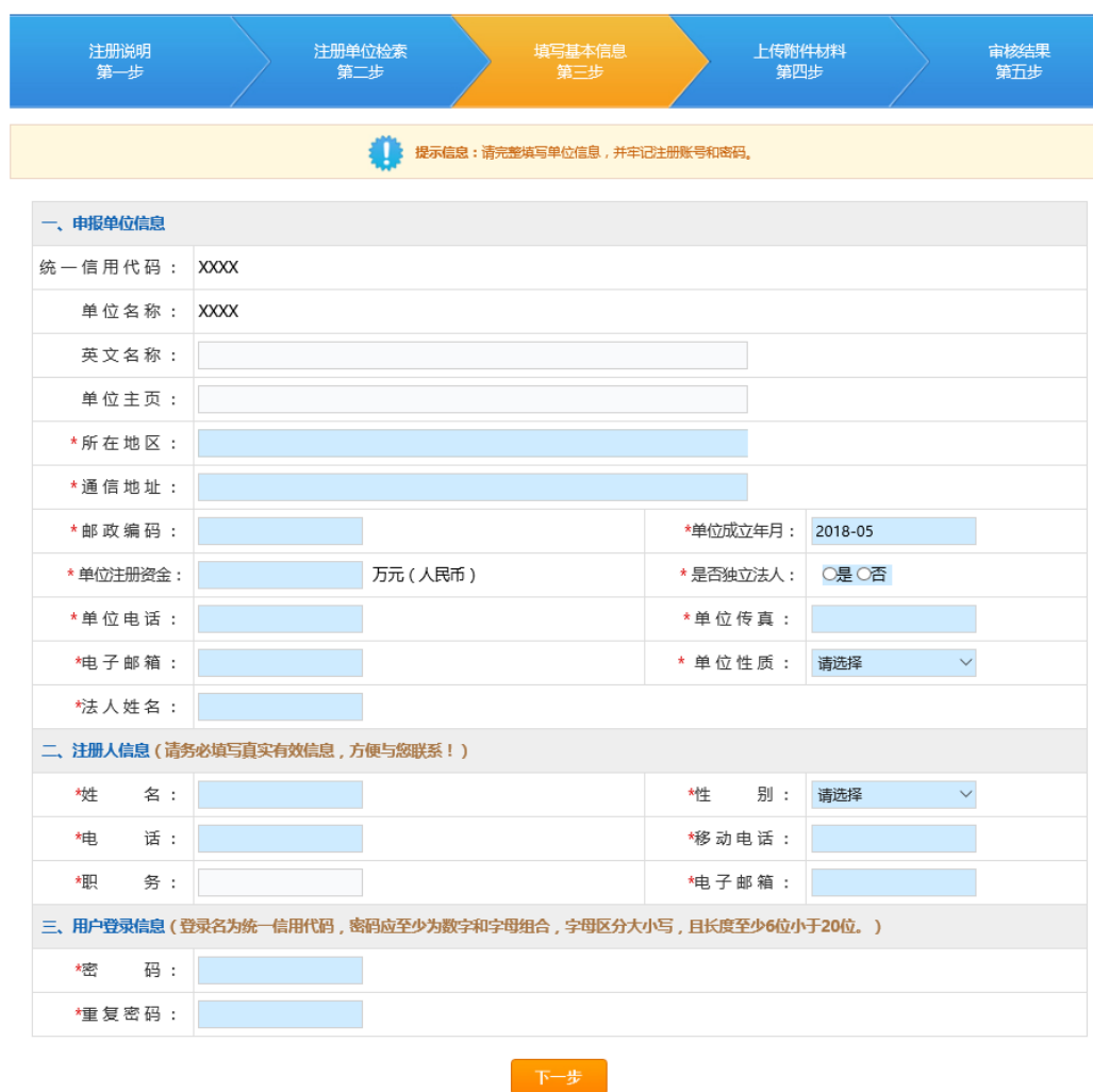
图 2-4 填写基本信息

4) 填写单位全称和统一信用代码，输入验证码，点击下一步进入“填写基本信息”页面（如图 2-4）。