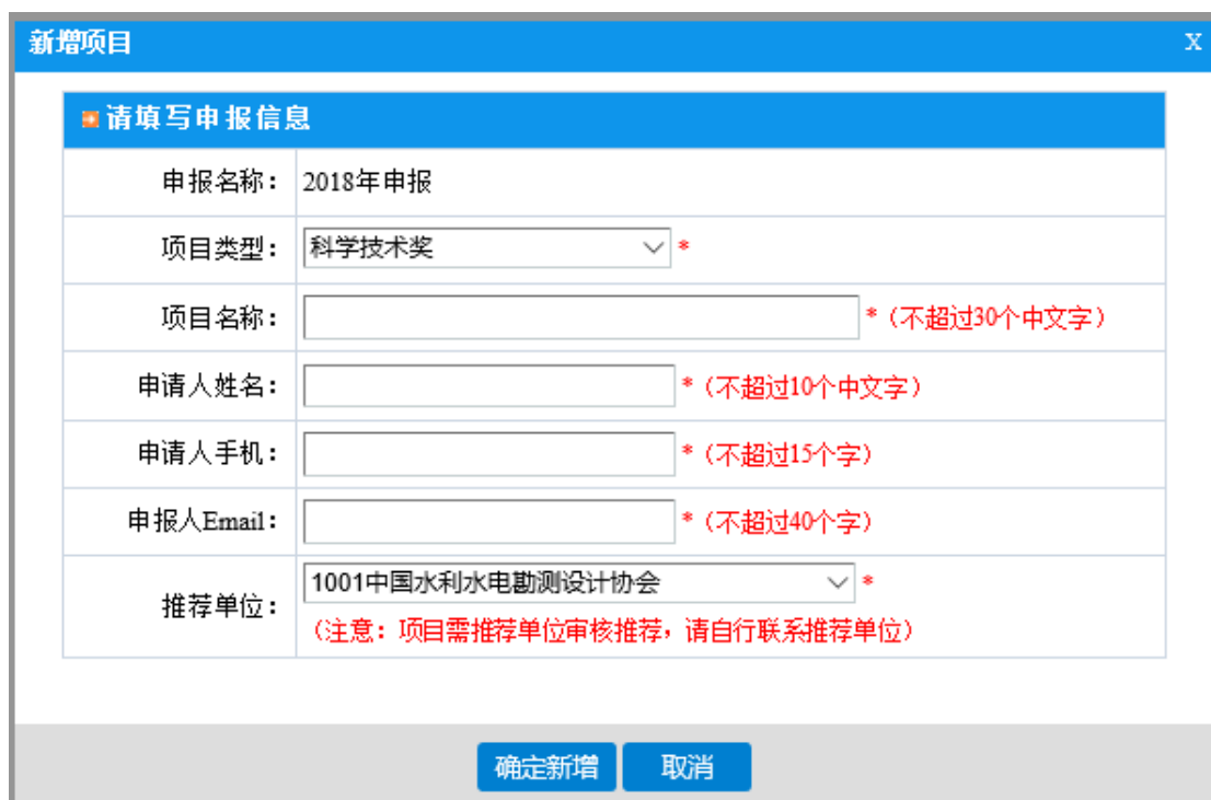
图 3-3 新增项目

3) 点击“新增项目申请”，弹出新增项目页面（如图 3-3）。请准确填写具体项目的申报信息并选择推荐单位。