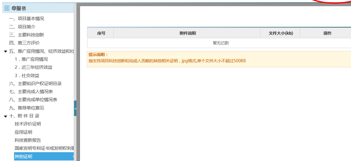
图 4-4 提交及下载

4) 填写过程中可点击“下载（PDF）”生成预览版申报书。全部内容填写完成并检查无误后点击“提交确认”，之后可下载正式版申报书。点击“取消提交”可对填报内容进行修改（如图 4-4）。推荐单位推荐后则无法再取消提交。