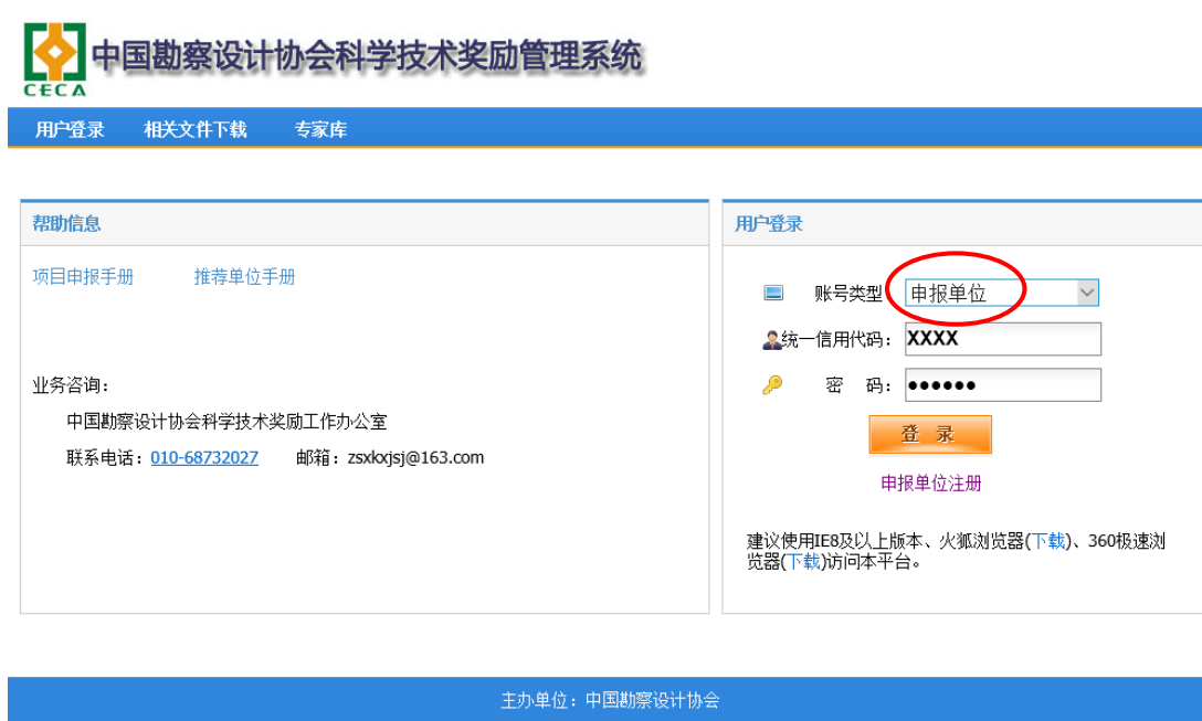
图 3-1 申报单位登录

1) 打开主页面，选择账号类型为申报单位，输入统一信用代码及密码，点击登陆进入申报单位系统（如图 3-1）。