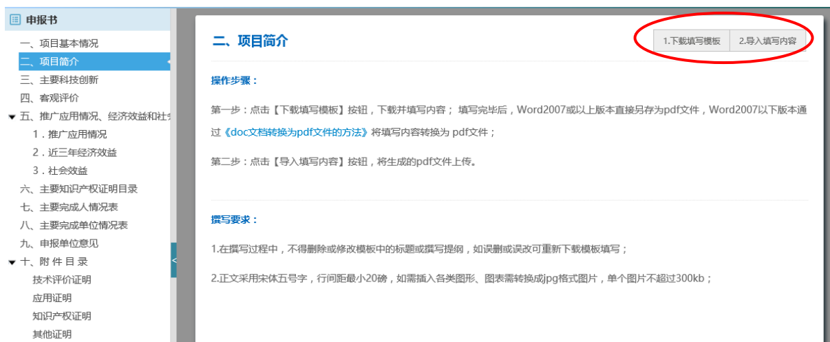
图 4-3 申报书填写（2）

4) 填写过程中可点击“下载（PDF）”生成预览版申报书。全部内容填写完成并检查无误后点击“提交确认”，之后可下载正式版申报书。点击“取消提交”可对填报内容进行修改（如图 4-4）。推荐单位推荐后则无法再取消提交。