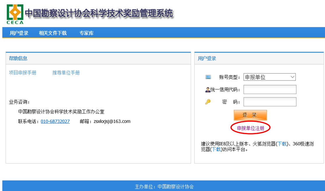
图 2-1 主页面

1) 输入网址 (http://www.chinaeda.org), 点击“中国勘察设计协会科学技术奖励管理系统”打开主页面 (如图 2-1)。