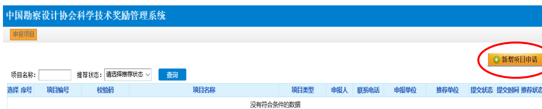
图 3-2 申报项目